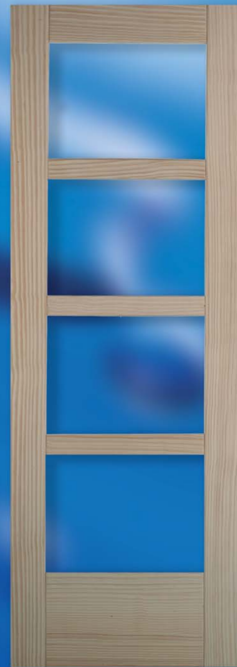
*Modelo LEÓN 4V