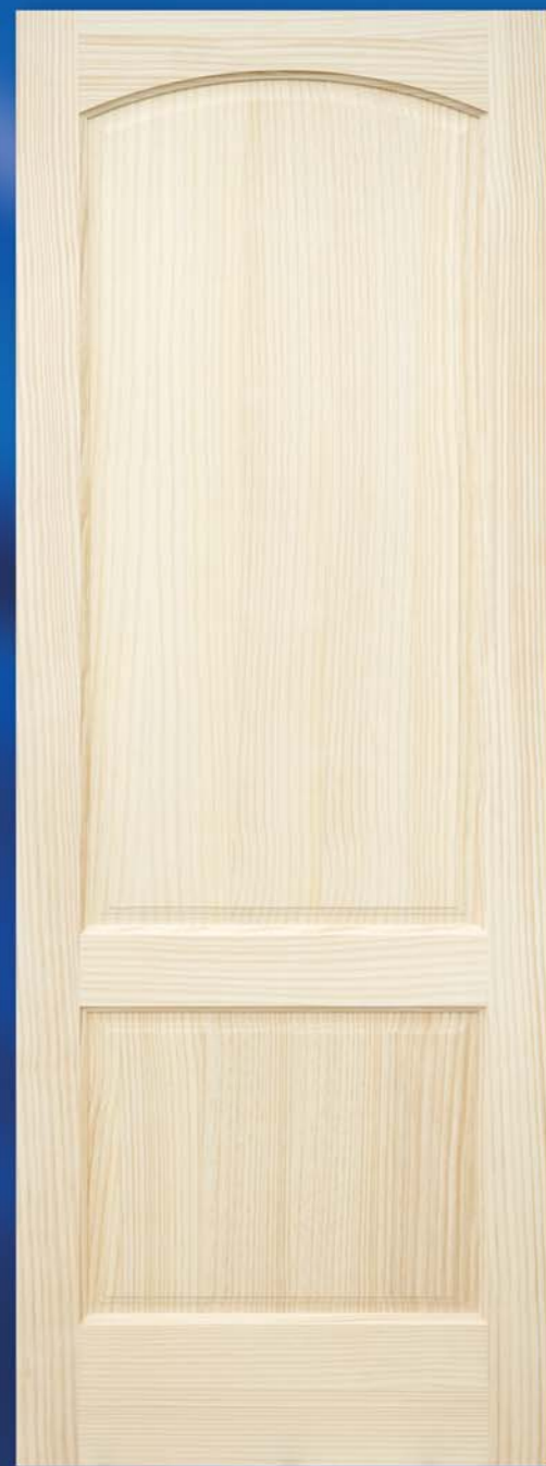
*Modelo 7 CP