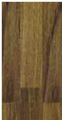
Nogal 3 Lamas Ref. 114.011.20