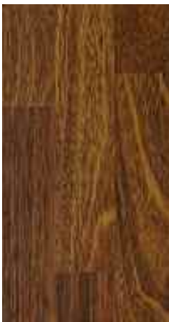
Merbau 3 Lamas Ref. 124.011.20