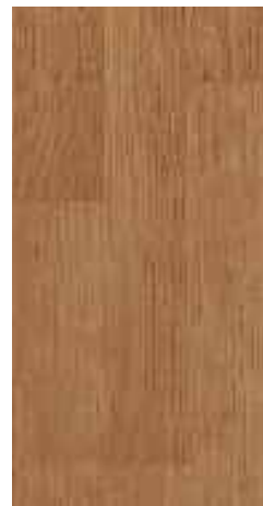
Cerezo 3 Lamas Ref. 09401120