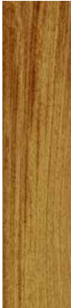
Iroko 1 Lama Ref. Bir04