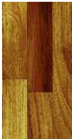
Iroko 3 Lamas Ref. 074.011.20