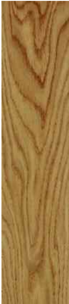
Roble rústico bisel 4 lados. Cepillado Ref. Bir01