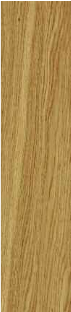
Roble natural 1 Lama Ref. Bir02