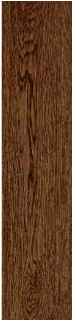
Roble fummé bisel 4 lados. Cepillado Ref. Bir03