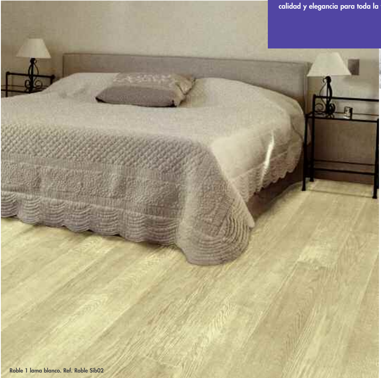
Roble 1 lama blanco. Ref. Roble Sib02