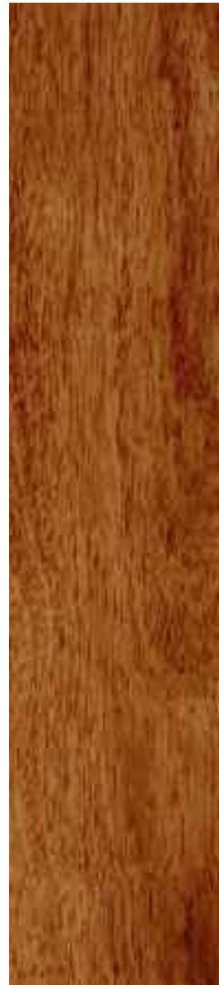
Jatoba 1 Lama Ref. Bir09