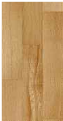
Haya vaporizada 3 Lamas Ref. 024.011.20