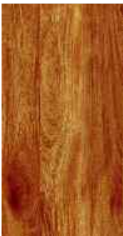
Doussie 3 Lamas Ref. 084.011.20