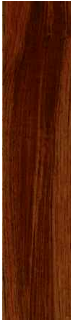
Teka Birmania 1 Lama Ref. Bir08