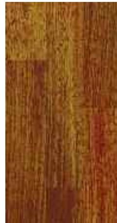
Jatoba 3 Lamas Ref. 102.055.20