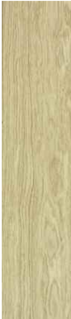
Roble 1 Lama blanco mate Ref. Roble Sib02