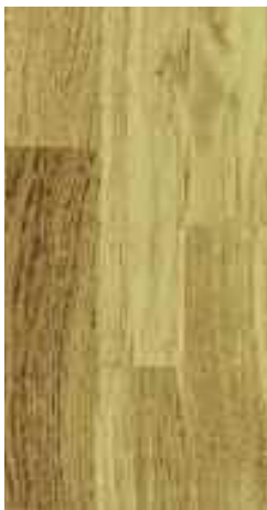
Roble 3 Lamas Ref. 014.511.11