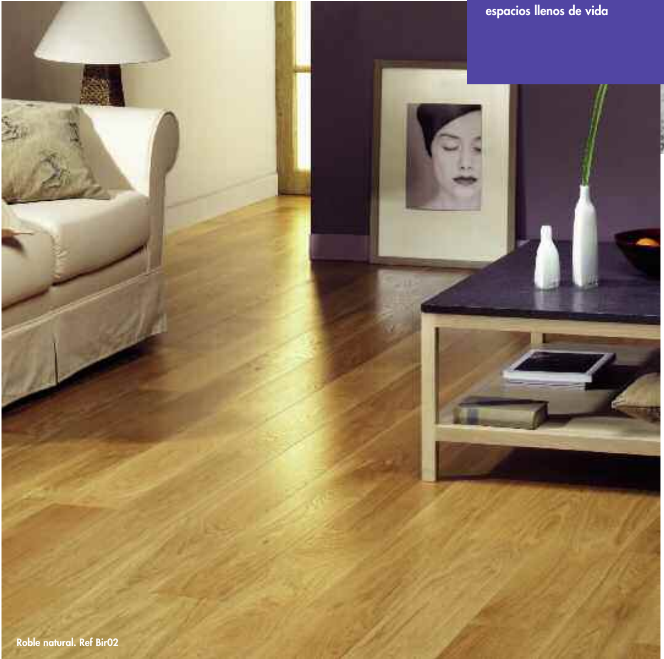
Roble natural. Ref Bir02