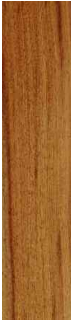
Pycado (merbau) Ref. Bir07