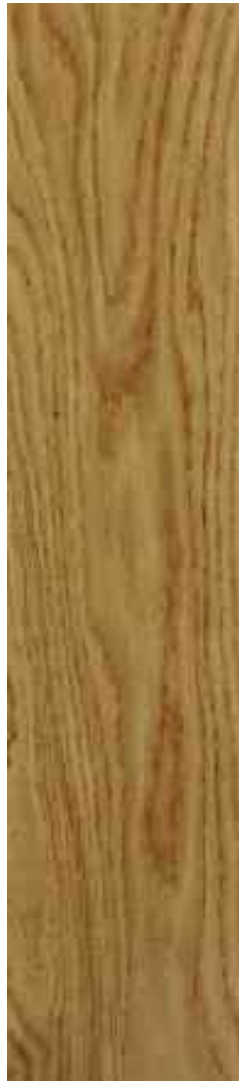
Roble 1 Lama accent Ref. Roble Sib04