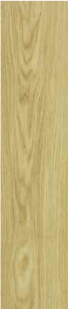
Roble excelsior 1 Lama Ref. Roble Sib01