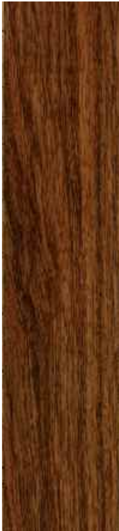
Nogat 1 Lama Ref. Bir06