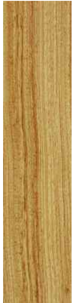
Doussie 1 Lama Ref. Bir05